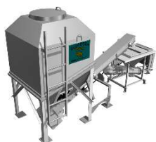
(らくらくぞうさん)

「らくらくぞうさん+ふたたび君」(NETIS 登録:KT-230116-A)によるモルタルの自動供給と MAI ポンプの遠隔操作を組み合わせることで、施工時の人員配置を見直し、省人化に貢献します。