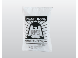
◆ PlaMモルタル (可塑性)