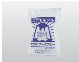
◆ CTモルタル (急硬・膨張)