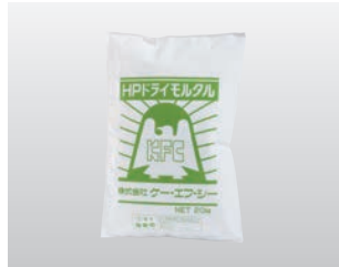
◆ HPドライモルタル (急硬・早期高強度)