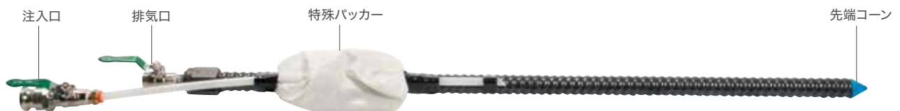
パッカーボルト諸元表