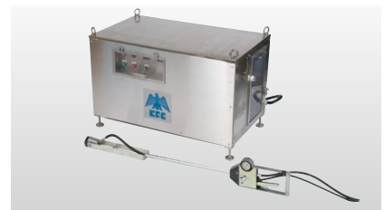
◆ 高耐力RPEポンプ+アーム