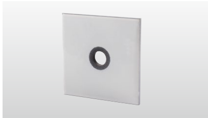
◆ シグナルワッシャー