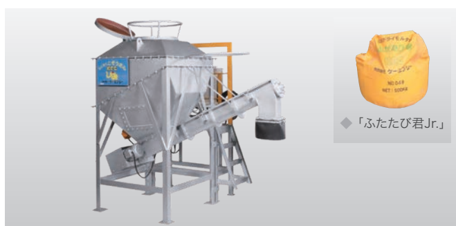
◆ モルタル自動投入機「こそうさん」