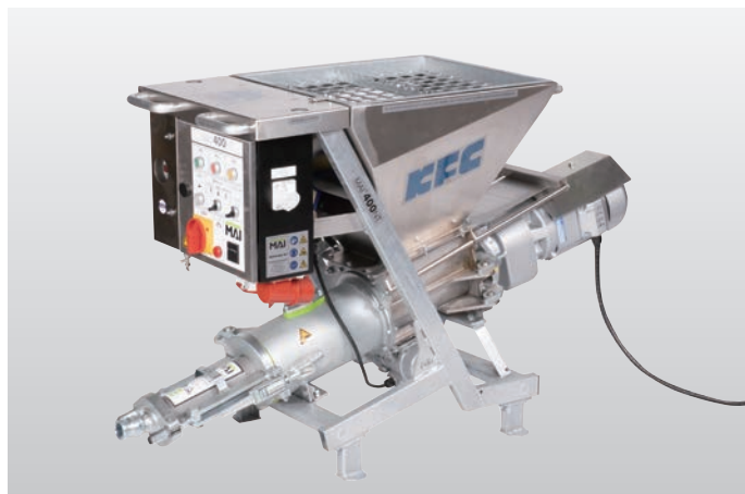
◆ MAIポンプ M400NT