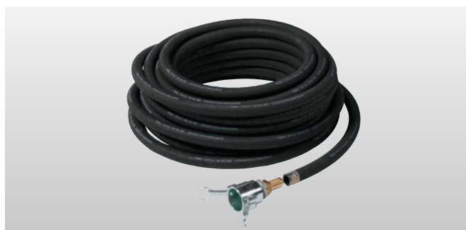
◆ モルタル注入ホース+ホースカップリング