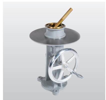
テーブルフロー試験 JIS R 5201