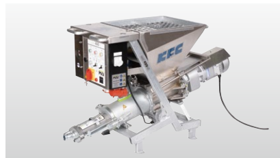
◆ MAIポンプ M400NT