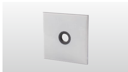
◆ シグナルワッシャー