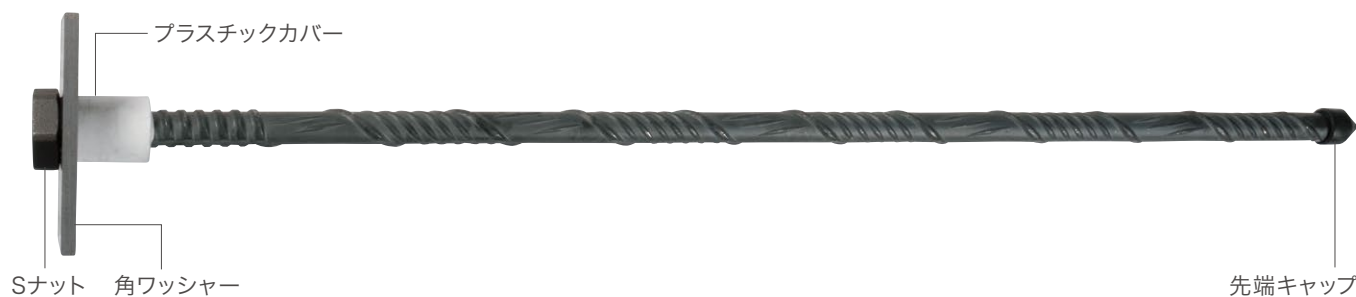
スーパースパイラルボルト SP24 諸元表