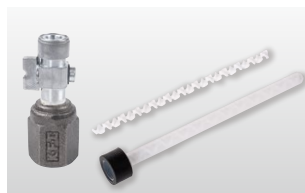
◆ ウレタン注入口+ スタティックミキサー