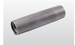
◆ ジョイントスリーブ