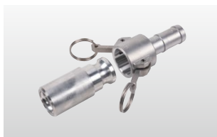
◆ モルタル注入プラグ