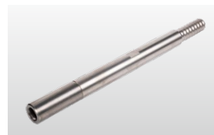
◆ 打ち込み延長ロッド