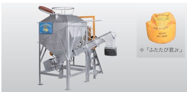
◆ モルタル自動投入機「こそうさん」