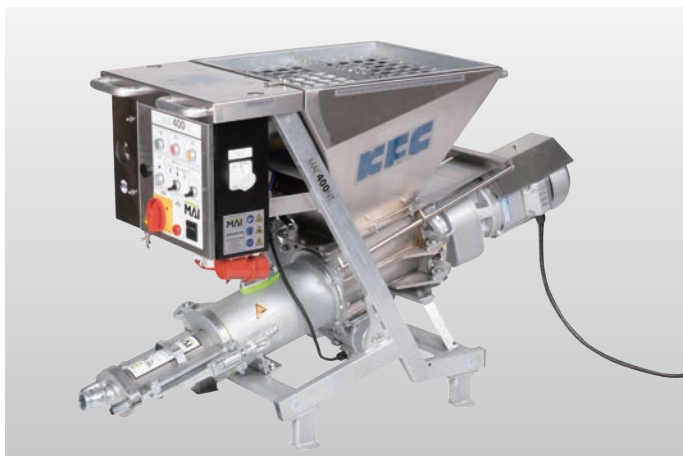
◆ MAIポンプ M400NT