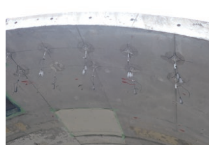
粘着力耐久性試験