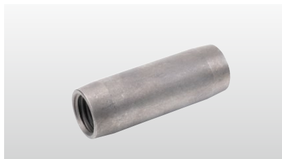
◆ ジョイントスリーブ