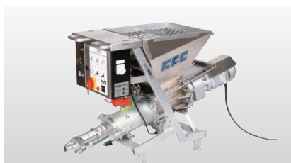
◆ MAIポンプ M400NT