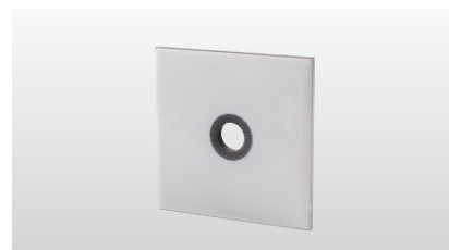
◆ シグナルワッシャー

※半球ワッシャーはベアリングプレートと組み合わせて使用します。 ※半球ワッシャー・ベアリングプレートは受注生産となります。