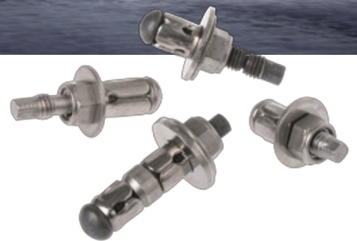
ワンサイドボルト セーフティワンサイドボルト