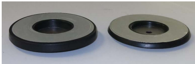
カーボディスク IH 型 (標準タイプ)