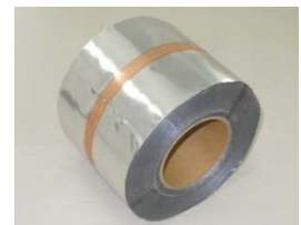
IH テープ(幅: 120 mm)

カーボディスク IH 型にはアルミラミネート材を貼り付けた標準タイプと薄型タイプ、更にカーボディスクに加熱材となるアルミメッシュを封入した恒久溶着性のメッシュタイプがあります。また幅 120 mm のテープ状の溶着材 IH テープもあり、用途に応じて様々な材料を提供させていただきます。