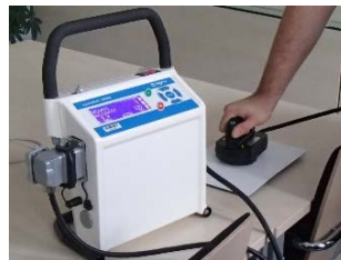
Induktofix W2000 USB