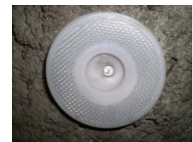
カーボディスク IH 型 (メッシュタイプ)